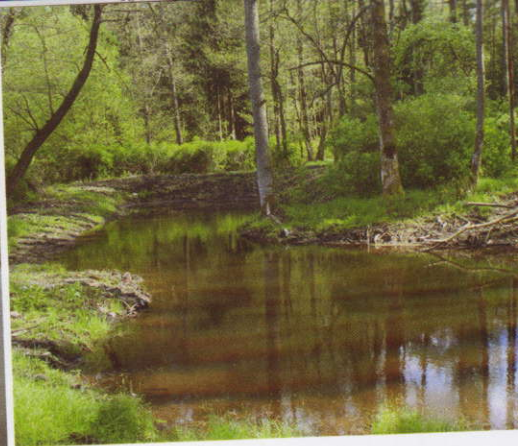
▲ Ze soustavy tůň v místě zaniklé osady Stoupa (realizace 2013).