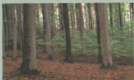
les s certifikátem FSC