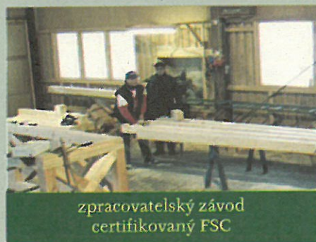
zpracovatelský závod certifikovaný FSC