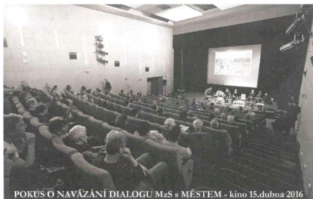
POKUS O NAVÁZÁNÍ DIALOGU MzS s MĚSTEM - kino 15.dubna 2016

Ať to dopadne jakkoli, naivně stále věřím v dobrá srdce kohokoli, zvláště Sušičáků a fandů Sušicka!